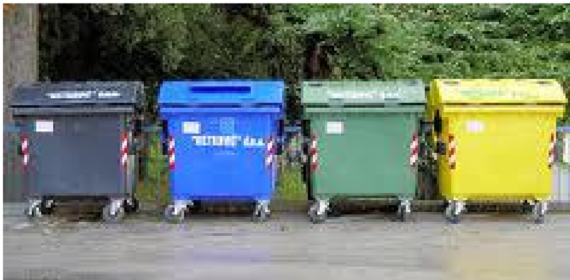
Slike 4. Primjeri zelenih otoka